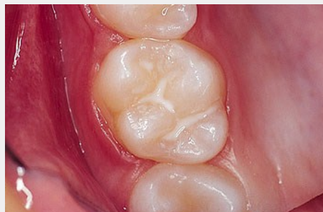
Schutz vor Karies: Versiegelung der feinen Grübchen auf der Kaufläche

Bei der Versiegelung werden die Fissuren mit einem hellen Kunststoff dauerhaft verschlossen, so dass an diesen Stellen keine Karies mehr entstehen kann (siehe Abb. unten).