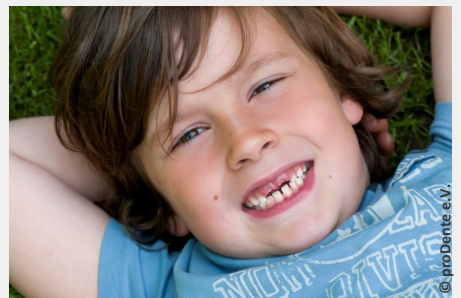
Bei der Prophylaxe lernen Ihre Kinder die richtige Zahnpflege

Es gibt also keinen Grund, warum Sie auf Prophylaxe für Ihre Kinder verzichten sollten.